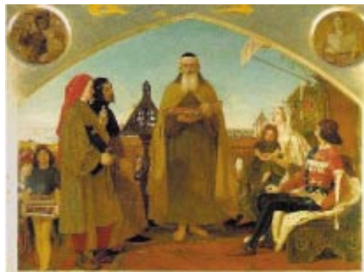
Brown, Ford Madox John Wycliffe leyendo su traducción de la Biblia a John of Gaunt 1847-61