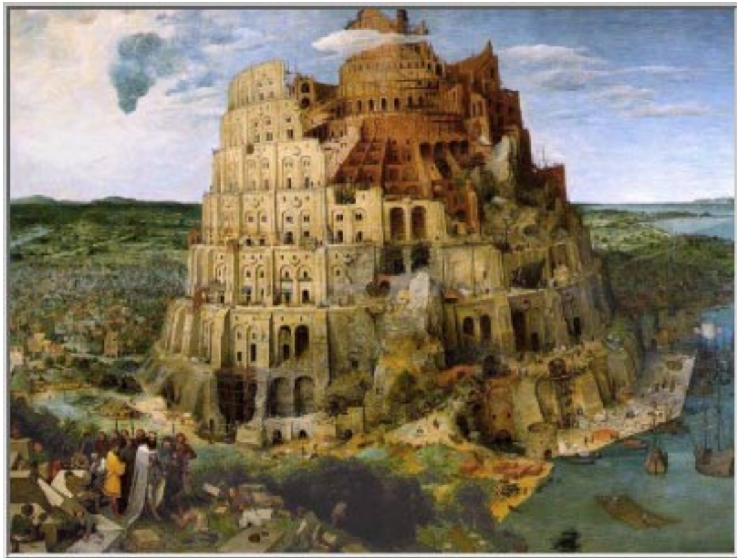
Bruegel, Pieter La torre de Babel 1563